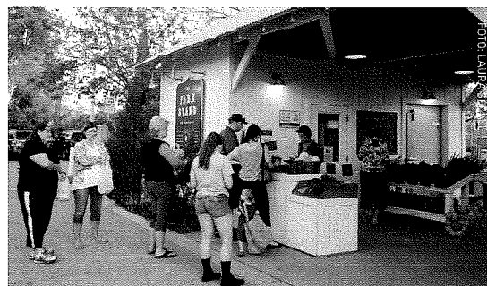
Torvet i Agritopia.