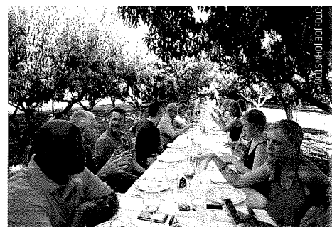
Frokost i det grønne i Agritopia.

I sig selv er by-landbrug ikke noget nyt. Danmark bærer på en over 500 år lang og smuk historie om organiseringen af fødevarer i og omkring vore byer. Fra det tidlige 20. århundrede bliver by-landbrug tilsvarende et middel til afhjælpning af fattigdom såvel som inspiration til skabelse af nye boligformer i byerne med ren luft og social inklusion som formål.